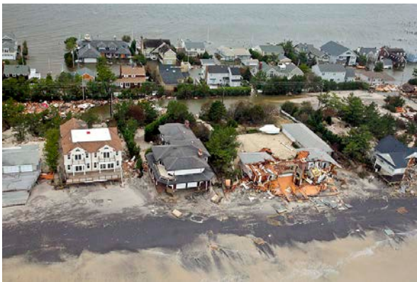
2012 年桑迪颶風侵襲美國，造成長灘島地區的房屋嚴重受損。