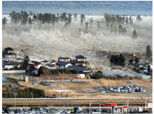
2011 年日本 311 大地震並引發海嘯，造成嚴重的人員傷亡及核電廠輻射外洩事件。