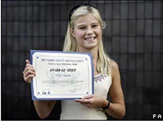
2004 年英國女孩「蒂利」因在南亞海嘯事件中拯救許多人而獲獎。